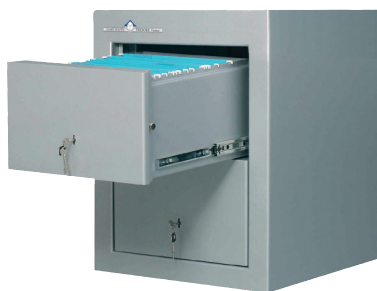
Modèle à 2 tiroirs, intégrable sous bureau.