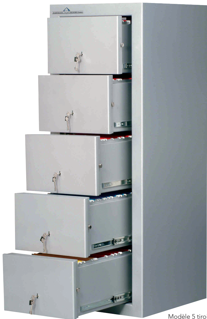
Modèle 5 tiroirs.