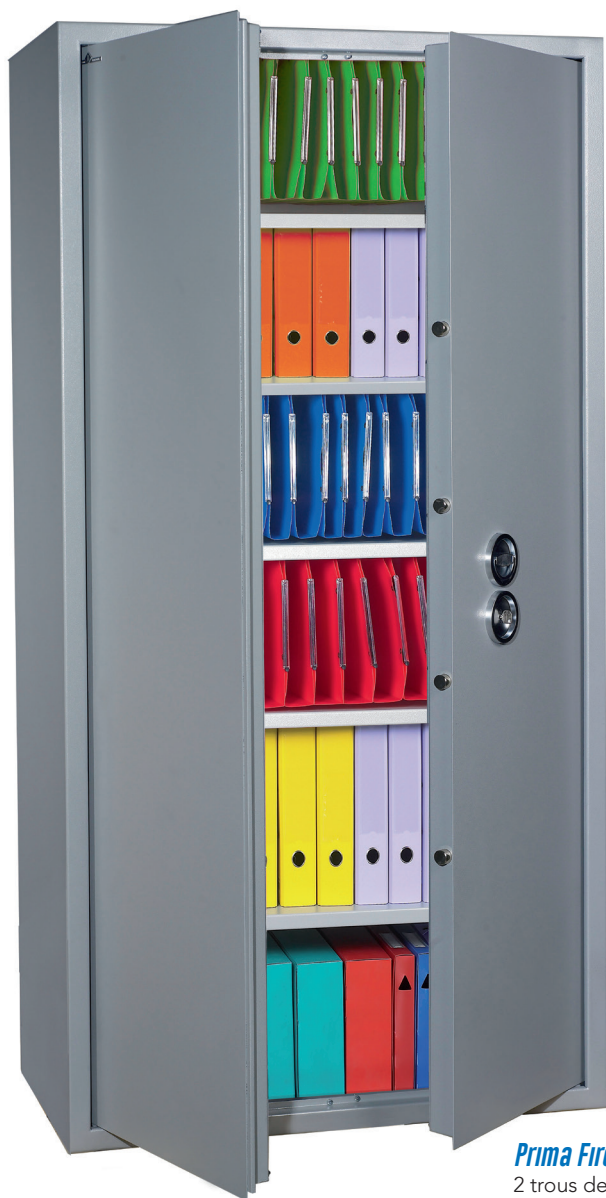
Prima Fire 700.

2 trous de scellement à la base ø 14 mm. Couleur gris Ral 9006.