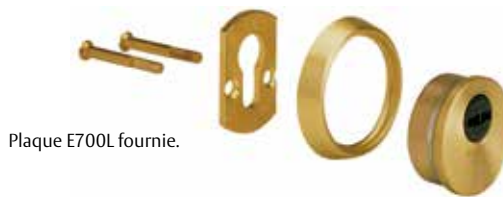
Plaque E700L fournie.